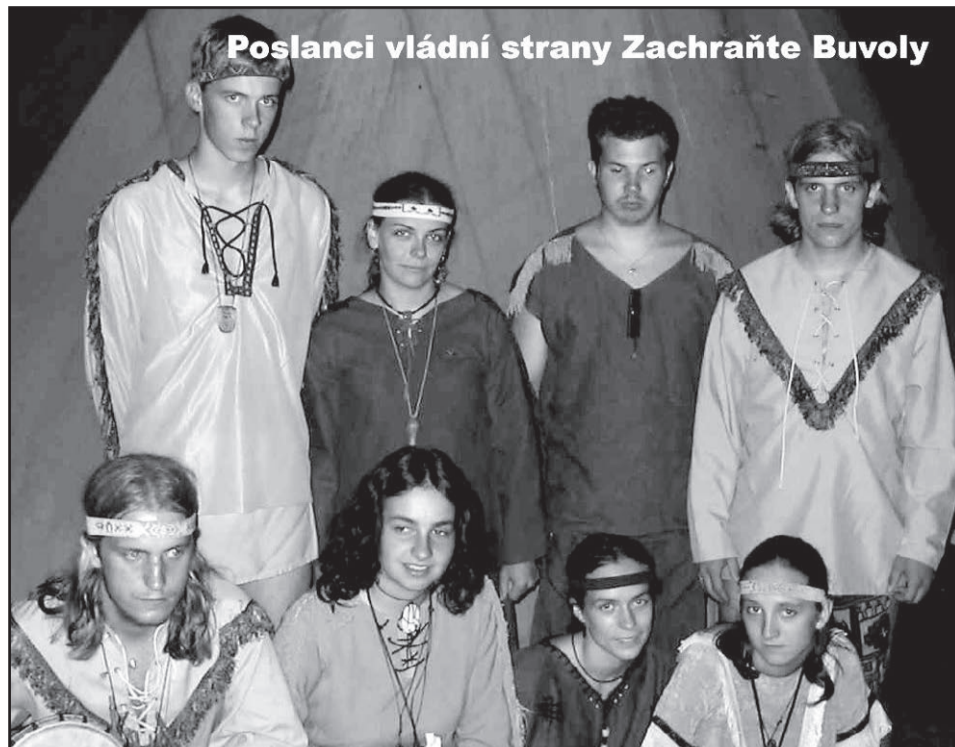
Poslanci vládní strany Zachraňte Buvoly

Když se někteří z poslanců Zachraňte Buvoly do sněmovny vrátili, snažili se figurínu zobrazující Mokasína v laksovém dresu s nápisem „Sud Ohnivé Vody daroval Ameriku zbohatlíkům“ odnést. Několik zástupců opozice se jim v tom vydalo zabránit a na chodbě se strhla bitka, v níž podle serveru Tombstone.com padaly rány pěsti. „Byl jsem na vyšetření u šamanky, mám 1,5 centimetrovou tržnou ránu na prdeli,“ řekl dnes tombstone.com poslanec opoziční strany Obyčejní in-